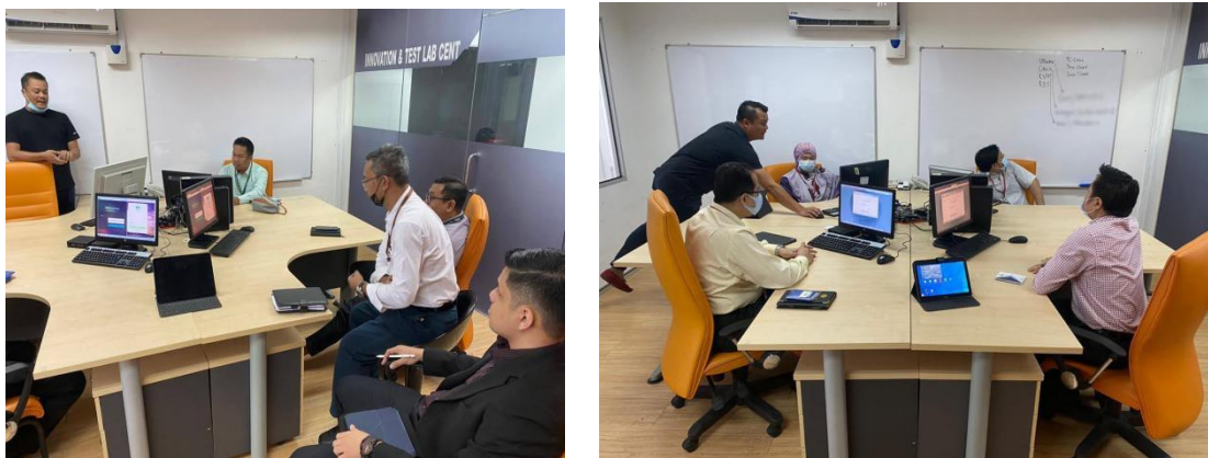
Rajah 1.1.3 Sessi Demonstrasi Virtual Desktop Infrastructure (VDI)

Sebagai syarikat penyedia Hyperconverge di Malaysia, PRB telah dilantik sebagai pembekal utama ( Distributor ) bagi Rantau Asia untuk produk Hypergrid.